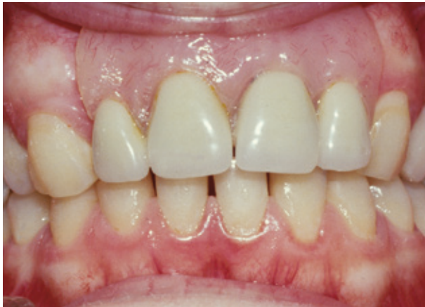
Plaatprothese van voren

De plaatprothese is gemaakt van een roze, tandvleeskleurige kunsthars. Daarin zijn de kunsttanden en -kiezen verankerd. De prothese rust in zijn geheel op het slijmvlies van de mond en zit eventueel met haakjes vast aan de overgebleven tanden of kiezen.