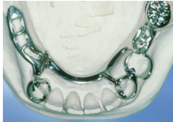
Frameprothese in metaal op een gipsmodel, zonder roze kunststof en kunsttanden en -kiezen

De frameprothese heeft een basis van metaal. Op het metaal is een roze, tandvleeskleurige kunsthars aangebracht. Daarin zitten de kunsttanden en -kiezen vast. In tegenstelling tot de plaatprothese rust de frameprothese vooral op de overgebleven tanden of kiezen en soms voor een deel op het slijmvlies van de mond. Met metalen ankers die op de tanden of kiezen steunen en met hun ankerarmen er omheen klemmen, is de frameprothese op de tanden en/of kiezen bevestigd. De ankerarmen zijn vaak wel enigszins zichtbaar.