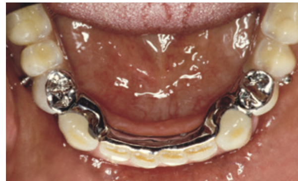
Frameprothese in de mond. De ankerarmen zijn enigszins zichtbaar.