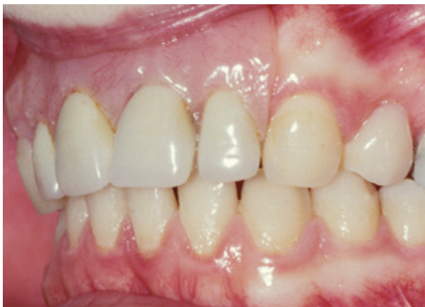
Plaatprothese van opzij